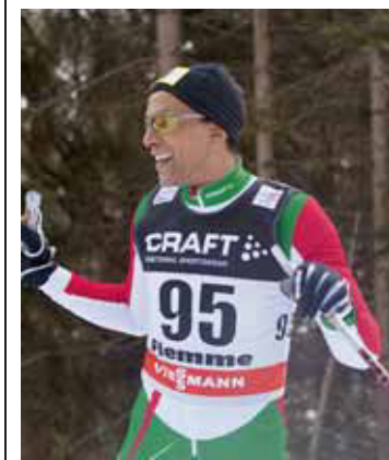
Jolie réflexion sur l'héritage familial et culturel.

Deux amis, Samir et Stéphane ont fondé ensemble une fabrique de ski de fond haut de gamme. Au bord de la faillite, Stéphane, ancien champion français, a l'idée de faire qualifier Samir pour les jeux olympiques sous les couleurs de son second pays: l'Algérie. La compétition olympique est le seul espoir pour sauver la boîte.