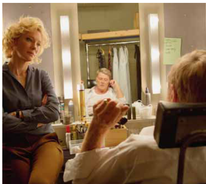
Pour la première fois réunis à l'écran, Cate Blanchett et Robert Redford toujours convaincants.