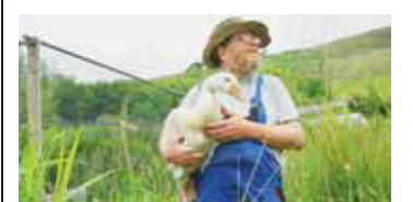
«Pourra-t-on éviter l'inéluctable? Un documentaire avec de vraies solutions. Pas de morale, mais de l'humanité et de l'enthousiasme.»