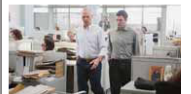
«Scénario bien ficelé, sujet citoyen, casting cinq étoiles, il ne manque qu'une mise en scène plus audacieuse pour en faire un grand film.»