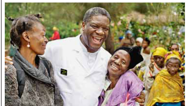
Honoré dans le monde entier, le Dr Mukwege a reçu de nombreuses récompenses, dont le Prix Sakharov en 2014.

A l'Est du Congo, depuis plus de 20 ans et au péril de sa vie, le docteur Demnis Mukwege répare les corps et les âmes de milliers de femmes violées. Le Belge Thierry Michel retrace son parcours (au quotidien, à l'hôpital, à l'étranger) au fil des horreurs guerrières impunies de son pays et nous donne à entendre plusieurs témoignages bou-